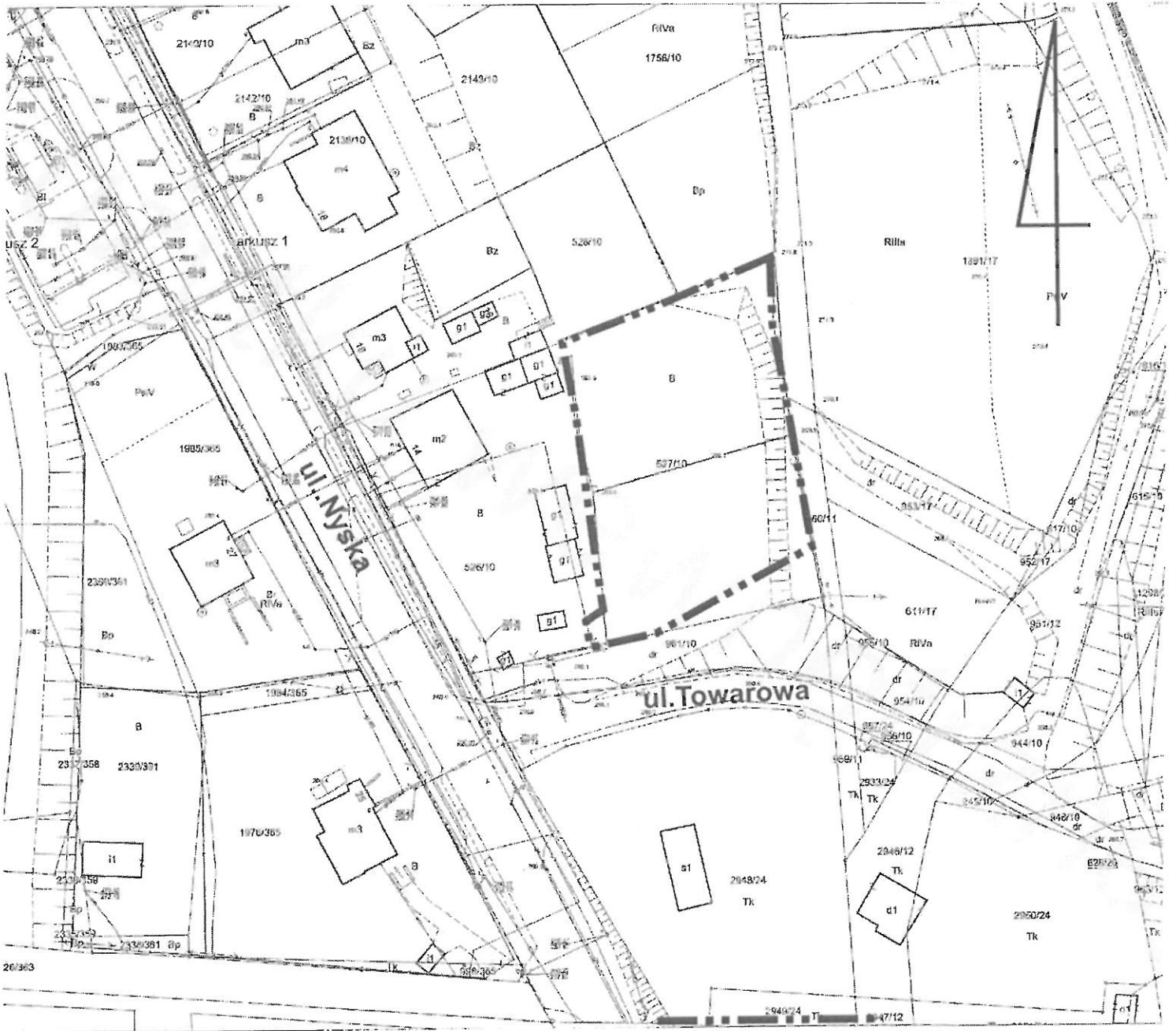
GRANICA ZMIANY PLANU S.1:1000

Załącznik Nr 2 do uchwały Nr ..... Rady Miejskiej w Prudniku z dnia 17 czerwca 2020 r.