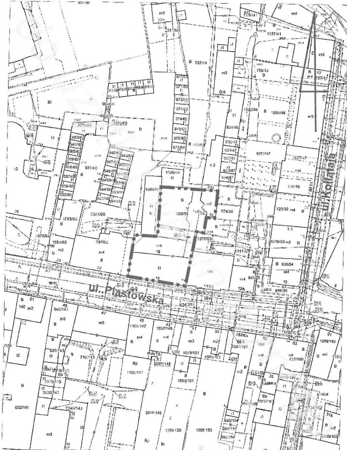
GRANICA ZMIANY PLANU S.1:1000

Załącznik Nr 4 do uchwały Nr ..... Rady Miejskiej w Prudniku z dnia 17 czerwca 2020 r.