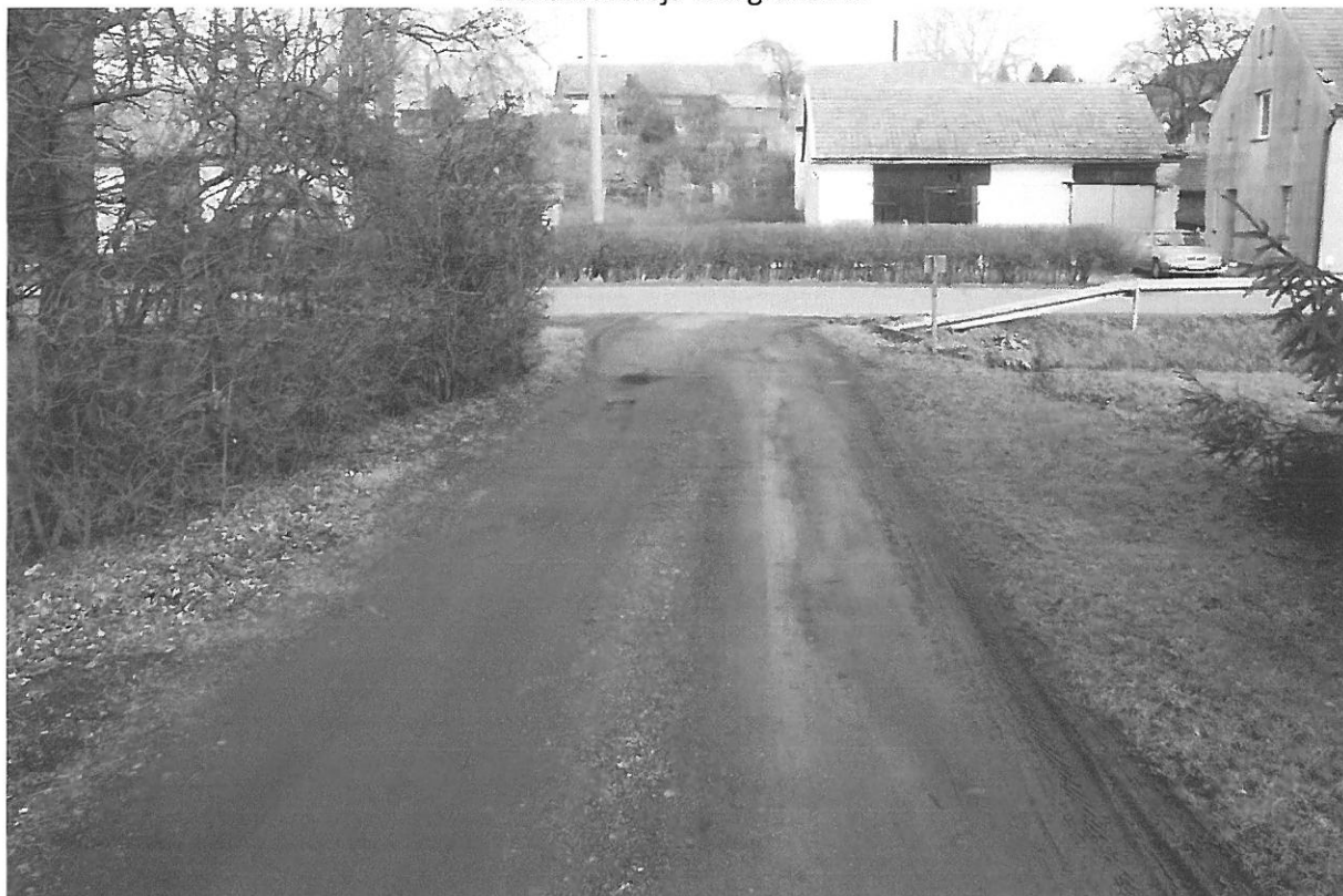
Fot. 1. Widok na zjazd od strony posesji