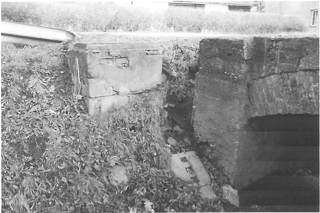
Fot. 5 Wypłukana skarpa od strony DP