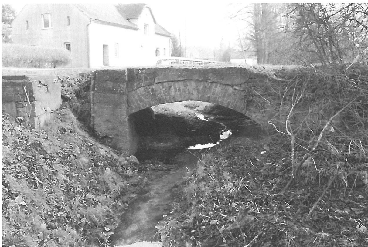
Fot. 4 Widok z boku od strony górnej wody