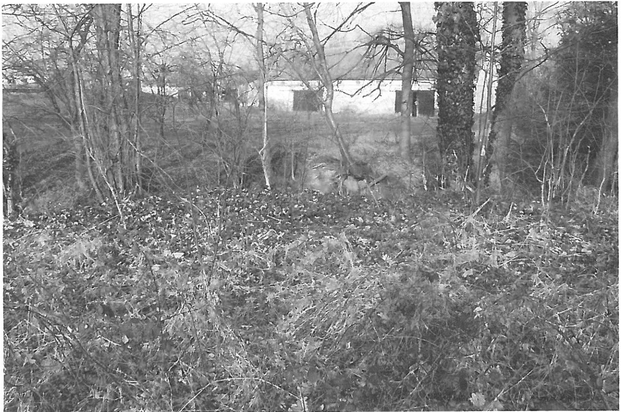
Fot. 12. Lokalizacja uszkodzonego w czasie powodzi mostu, który nie został odbudowany.