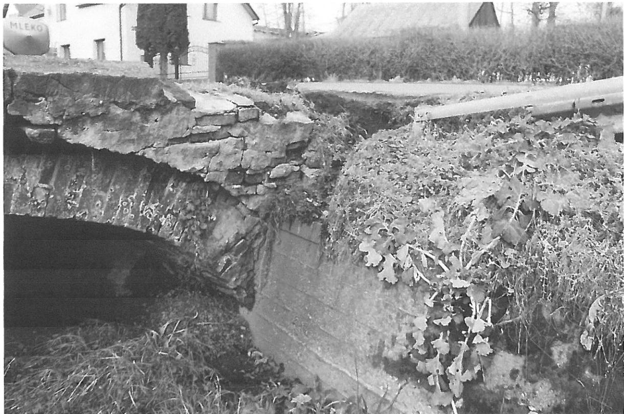
Fot. 6 Wypłukana skarpa od strony DP. Uszkodzona konstrukcja ściany nad łukiem, uszkodzony gzyms.