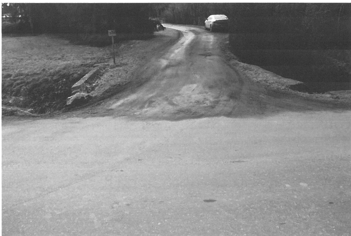
Fot. 2 Widok na zjazd od strony drogi powiatowej