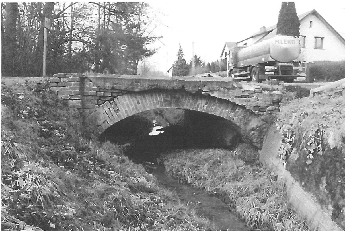
Fot. 3 Widok z boku od strony dolnej wody