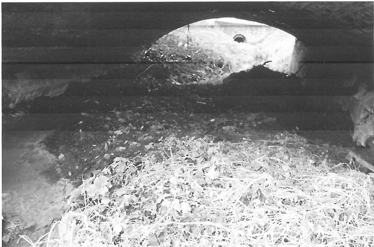
Fot. 8. Zanieczyszczenie koryta cieku utrudniające swobodny spływ wód. Opaski betonowe uszkodzone w czasie powodzi.