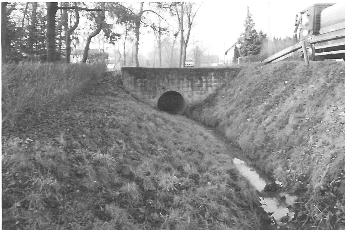
Fot. 9. Obiekt na dojeździe do sąsiedniej posesji przebudowany po powodzi w latach 70-tych