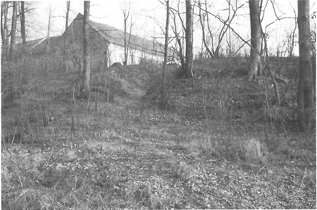
Fot. 13. Droga na działce 816 od strony nieistniejącego mostu uszkodzonego w czasie powodzi w latach 70-tych.