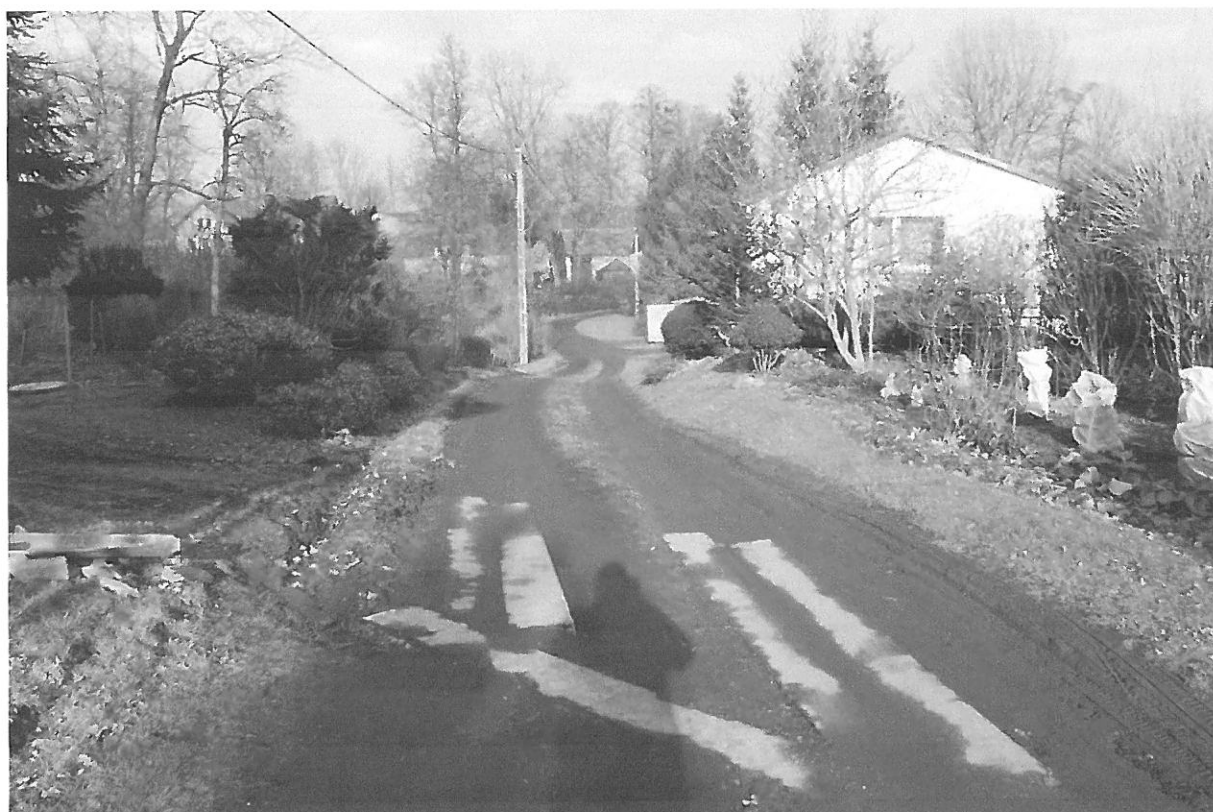
Fot. 10. Widok obecnego dojazdu do posesji (widoczny dom na posesji 233a)