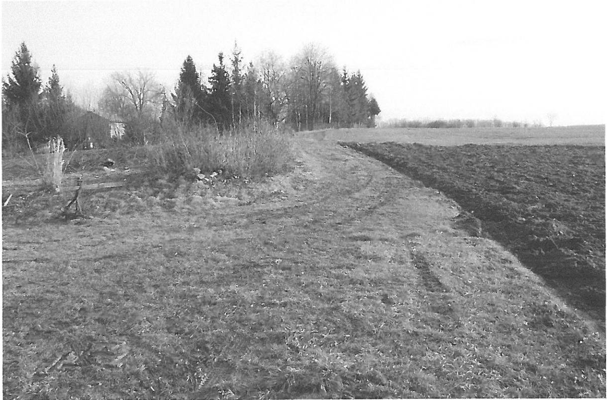
Fot. 11. Droga stanowiąca ewentualny alternatywny dojazd od strony południowej (działka 816)