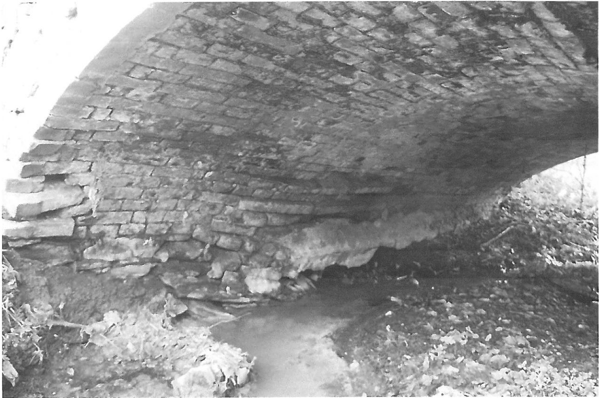
Fot. 7 Fundamenty uszkodzone w czasie powodzi