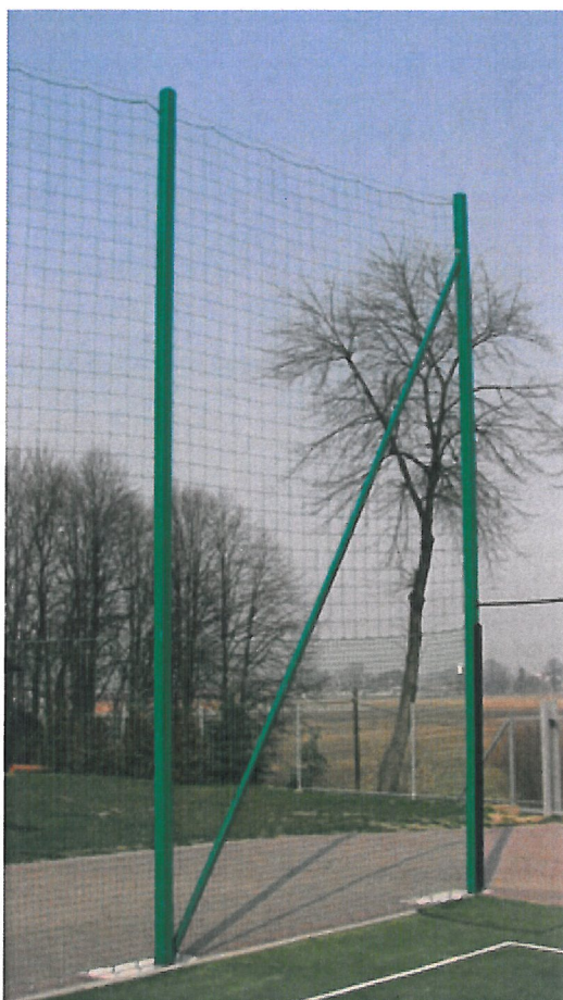
Przykładowe zdjęcie piłkochwytu.

Po zakończeniu robót ogólnie budowlanych związanych z obiektem teren wokół obiektu należy uporządkować.