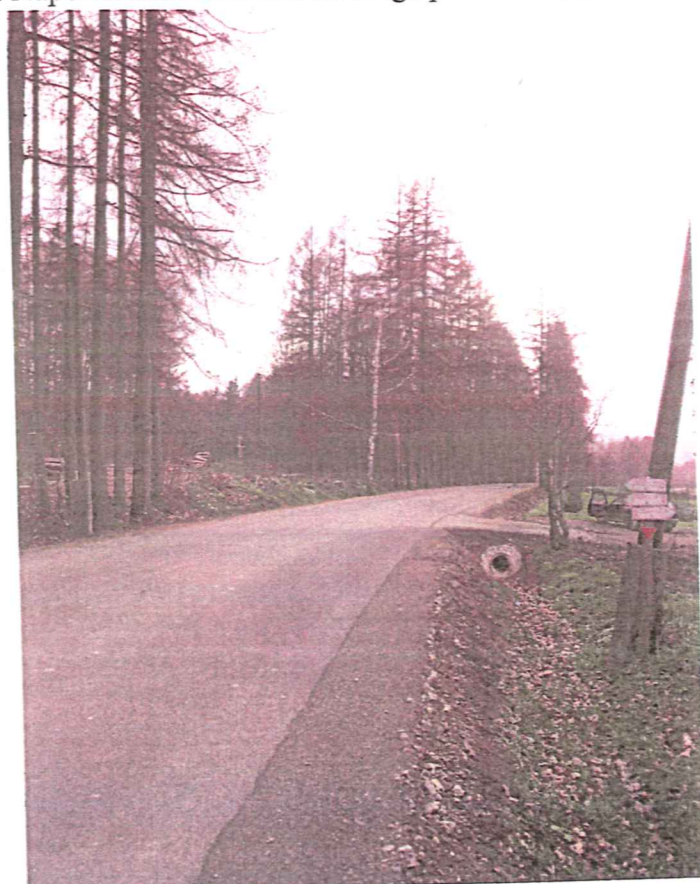
3. Napowietrzna linia SN na droga powiatową (dz. nr 155/4)