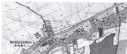
Wyrys ze studium uwarunkowań i kierunków zagospodarowania przestrzennego gminy Prudnik